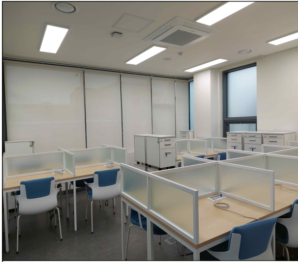
Pre-BI 입주공간 - 1인 공유좌석(4F)