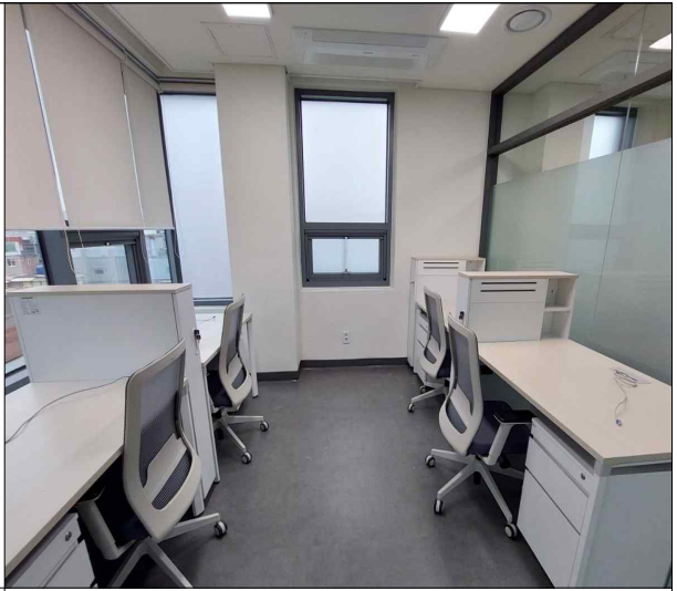
BI입주공간 - 4인실 (5F)