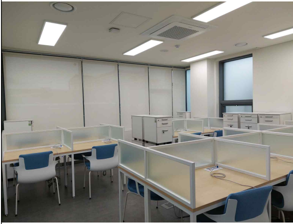
Pre-BI 입주공간 - 1인 공유좌석(4F)