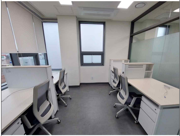
BI입주공간 - 4인실 (5F)