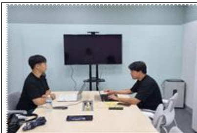
BM고도화 프로그램(CIC, CBMA)