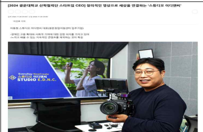
CC(Ceo's Content) 프로그램