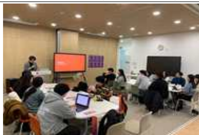
C to C(Content to Content)