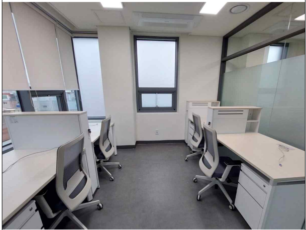
BI입주공간 - 4인실 (5F)