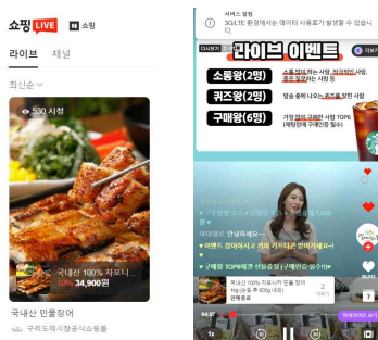
<네이버 쇼핑 LIVE 화면>