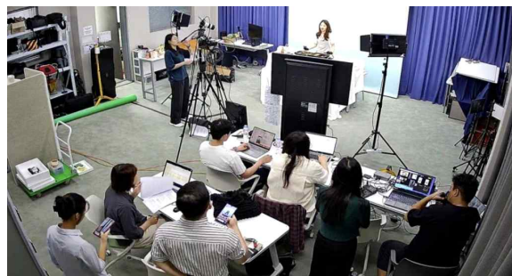
<라이브 커머스 방송 송출 현장>